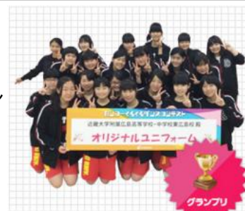
部活動部門 グランプリ 近大東広島中学・高校ダンス同好会の皆様

2013年にはHIPHOP調のオリジナル曲第2弾や、「学校ダンス授業カリキュラム」を追加制作、2015年にはオリジナル曲第3弾追加制作や教材の販売開始など、広く展開を続けております。